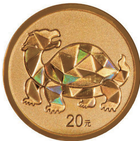
2克圆形精制金质纪念币背面图案