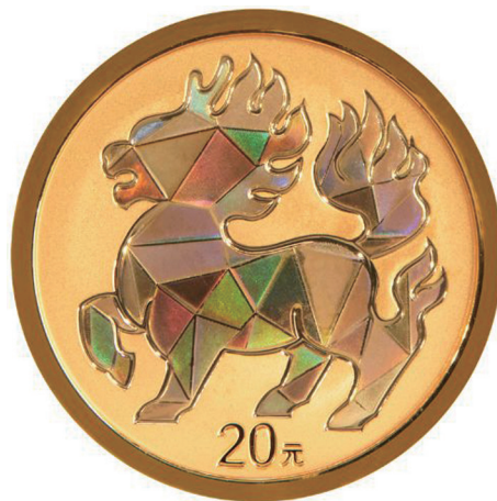
2克圆形精制金质纪念币背面图案