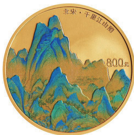
50克圆形精制金质纪念币背面图案