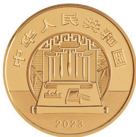
50克圆形精制金质纪念币正面图案