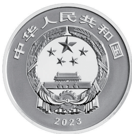
15克圆形精制银质纪念币正面图案