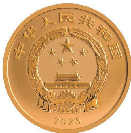
2克圆形精制金质纪念币正面图案