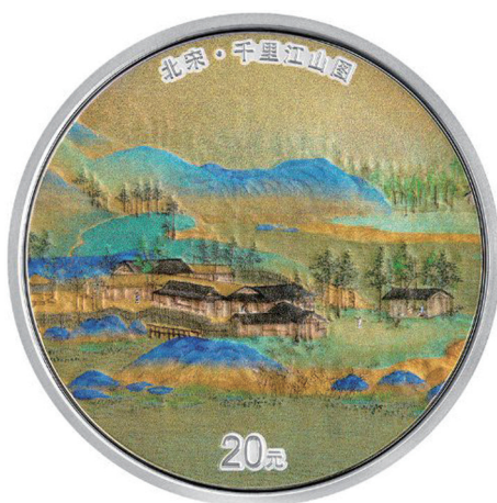
60克圆形精制银质纪念币背面图案