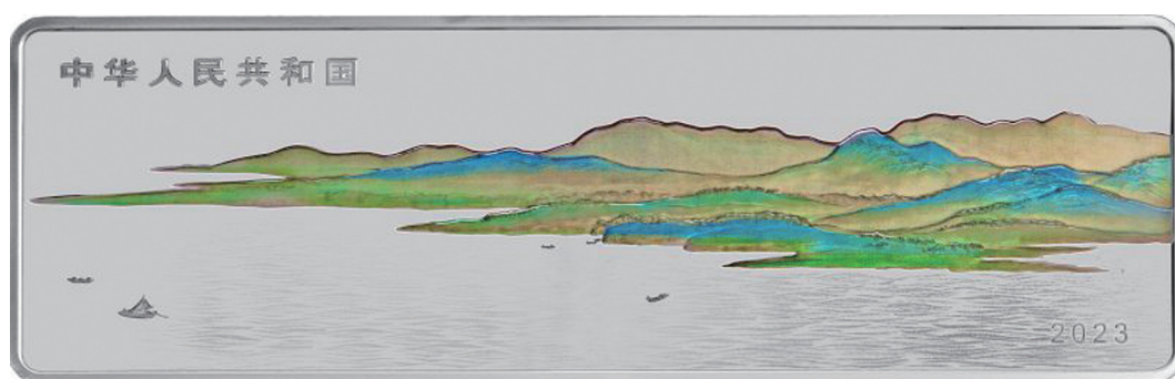
500克长方形精制银质纪念币正面图案