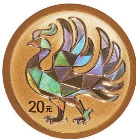
2克圆形精制金质纪念币背面图案