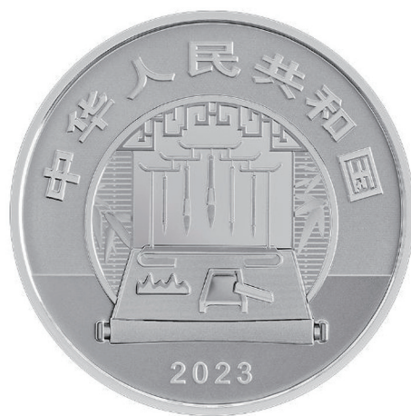
60克圆形精制银质纪念币正面图案