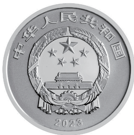
15克圆形精制银质纪念币正面图案