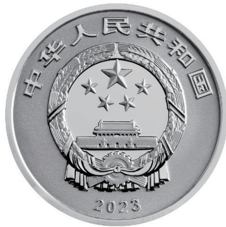
15克圆形精制银质纪念币正面图案