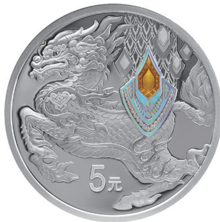
15克圆形精制银质纪念币背面图案