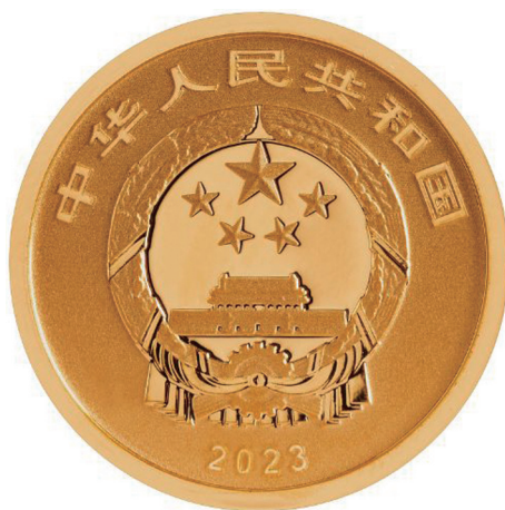
2克圆形精制金质纪念币正面图案