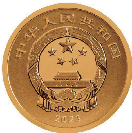
2克圆形精制金质纪念币正面图案