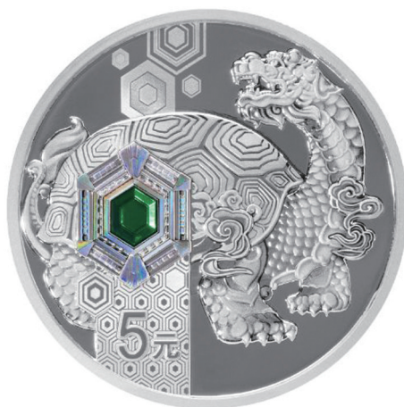
15克圆形精制银质纪念币背面图案