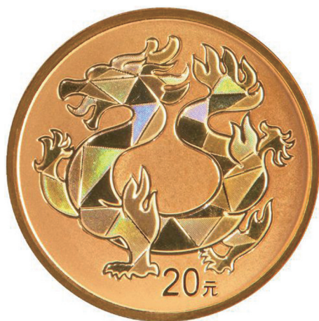
2克圆形精制金质纪念币背面图案