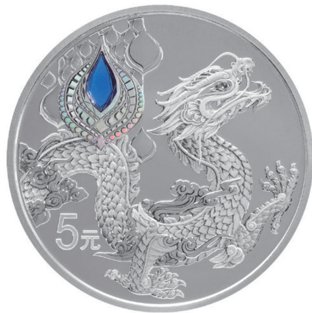
15克圆形精制银质纪念币背面图案