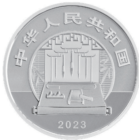
60克圆形精制银质纪念币正面图案