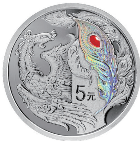
15克圆形精制银质纪念币背面图案