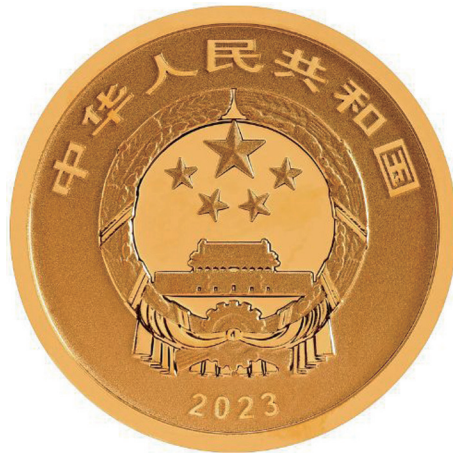
2克圆形精制金质纪念币正面图案