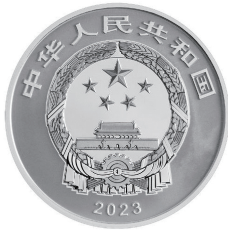
15克圆形精制银质纪念币正面图案