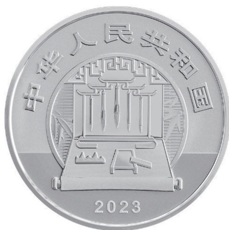
60克圆形精制银质纪念币正面图案