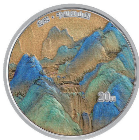
60克圆形精制银质纪念币背面图案