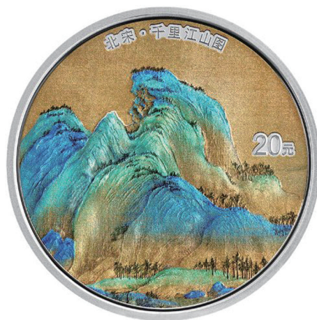
60克圆形精制银质纪念币背面图案