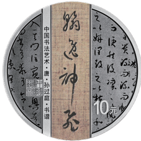
30克圆形精制银质纪念币背面图案