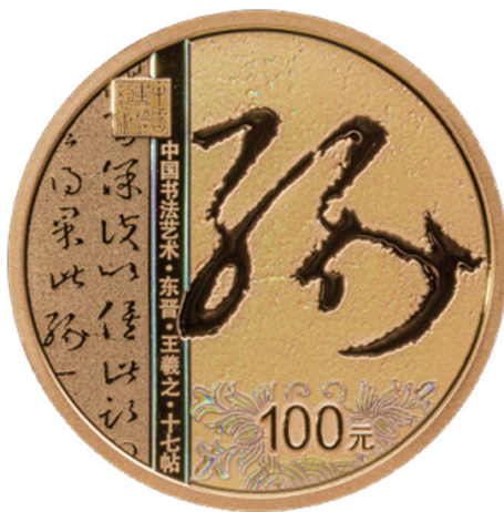
8克圆形精制金质纪念币背面图案