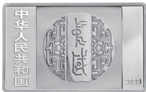
150克长方形精制银质纪念币正面图案