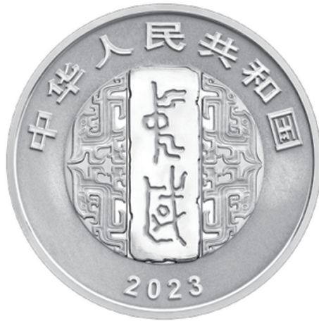
30克圆形精制银质纪念币正面图案