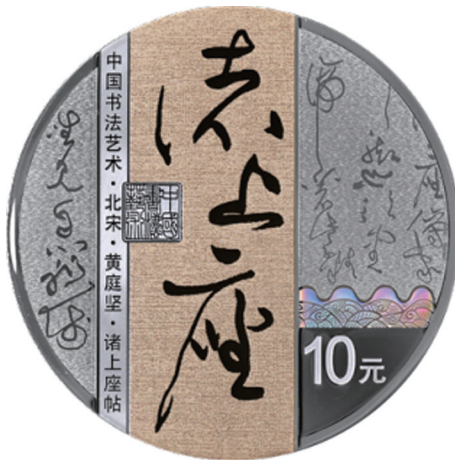
30克圆形精制银质纪念币背面图案