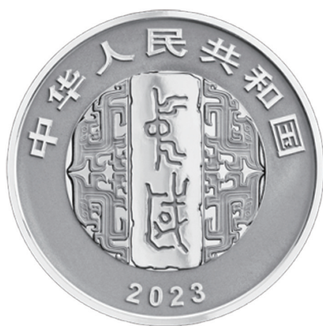
30克圆形精制银质纪念币正面图案