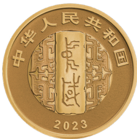
8克圆形精制金质纪念币正面图案