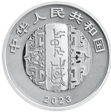
30克圆形精制银质纪念币正面图案