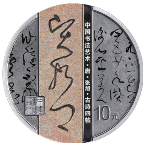
30克圆形精制银质纪念币背面图案