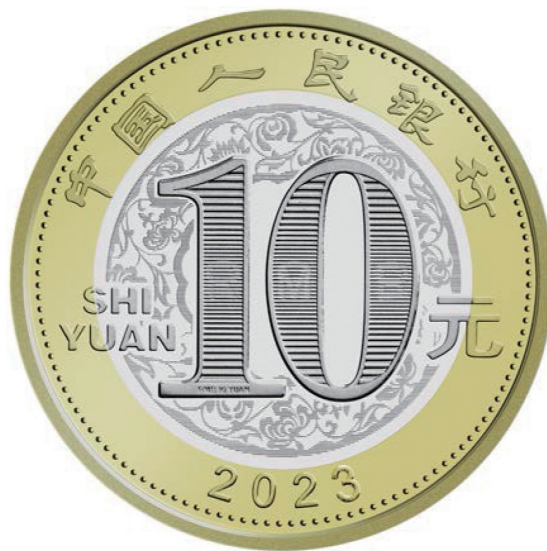
2023 年贺岁双色铜合金纪念币正面图案