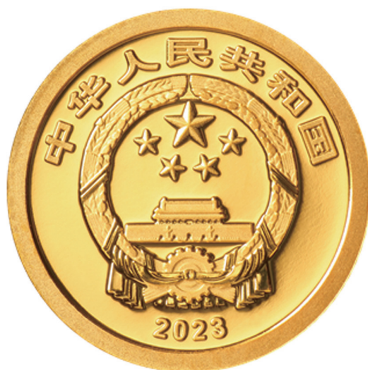
1 克圆形普制金质纪念币正面图案