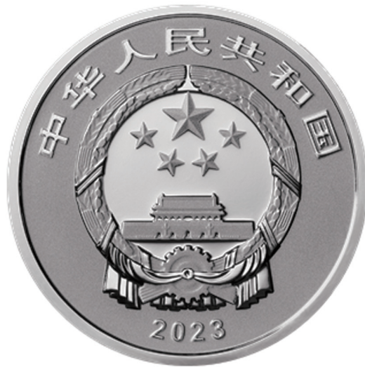
8克圆形普制银质纪念币正面图案