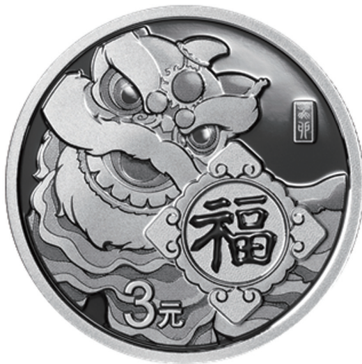
8克圆形普制银质纪念币背面图案