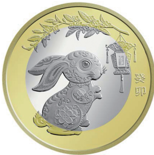
2023 年贺岁双色铜合金纪念币背面图案