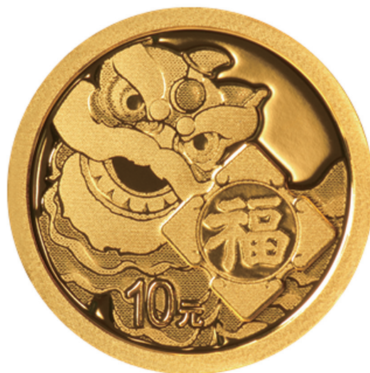
1 克圆形普制金质纪念币背面图案