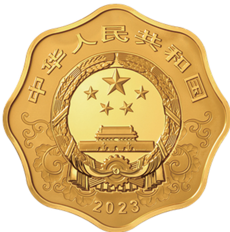
1公斤梅花形精制金质纪念币正面图案