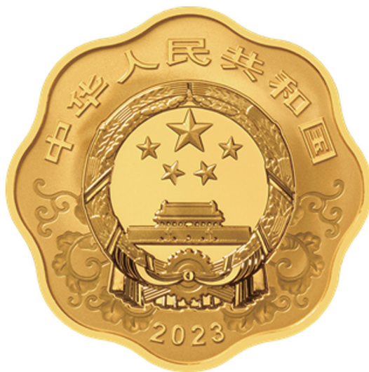
15克梅花形精制金质纪念币正面图案