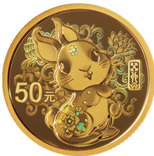
3克圆形精制金质纪念币背面图案