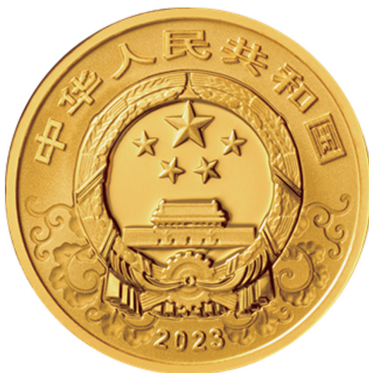
3克圆形精制金质纪念币正面图案