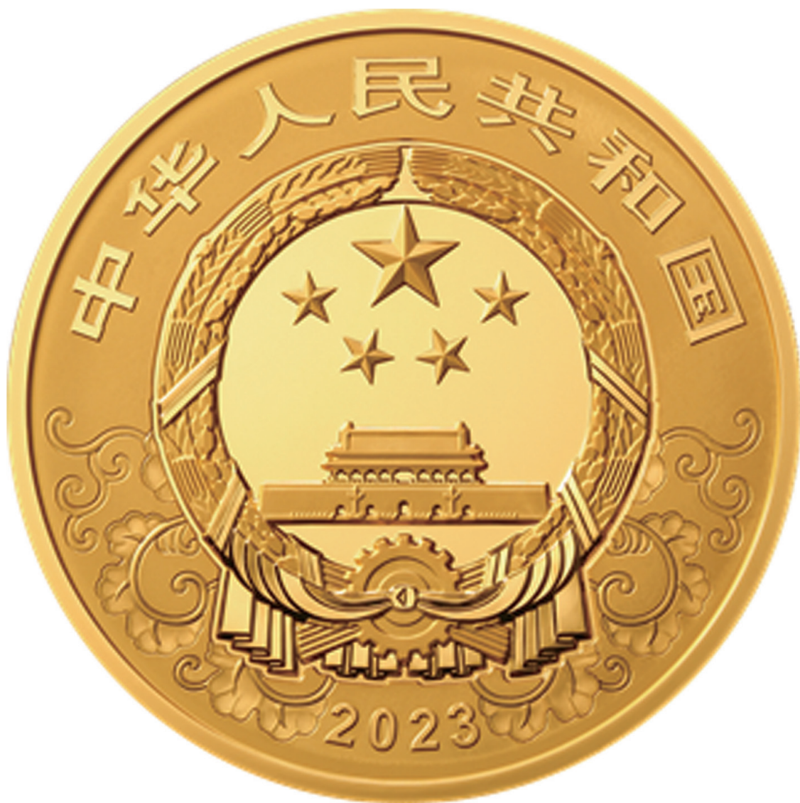
10公斤圆形精制金质纪念币正面图案