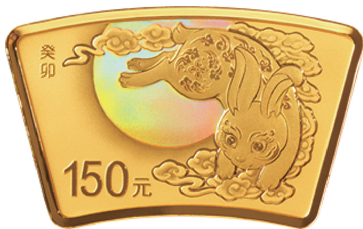
10克扇形精制金质纪念币背面图案