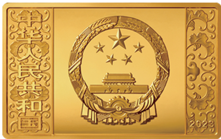
150克长方形精制金质纪念币正面图案