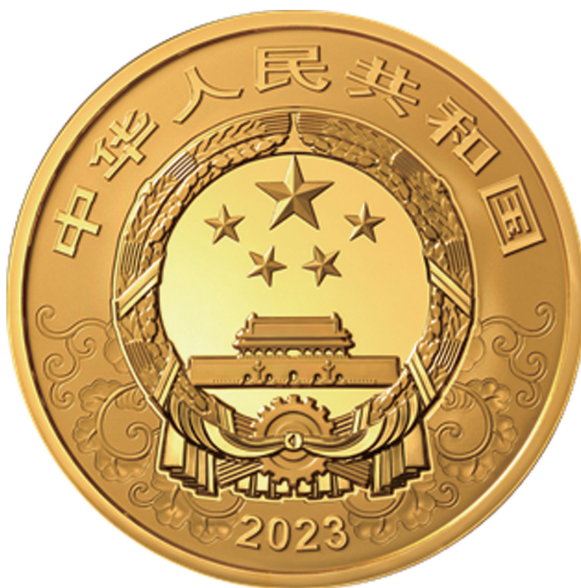
2公斤圆形精制金质纪念币正面图案