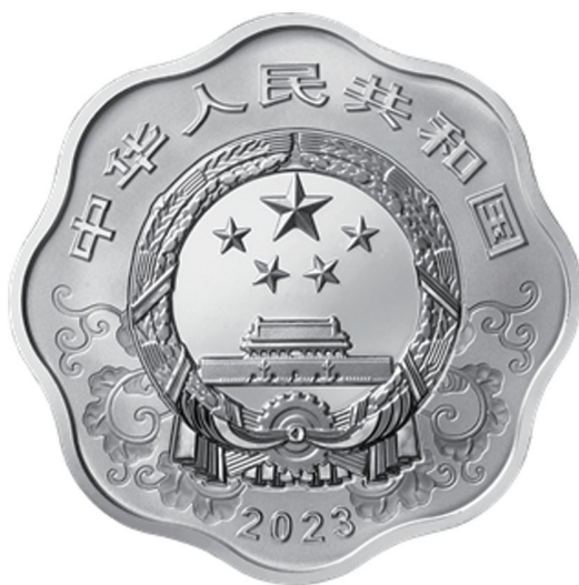
30克梅花形精制银质纪念币正面图案