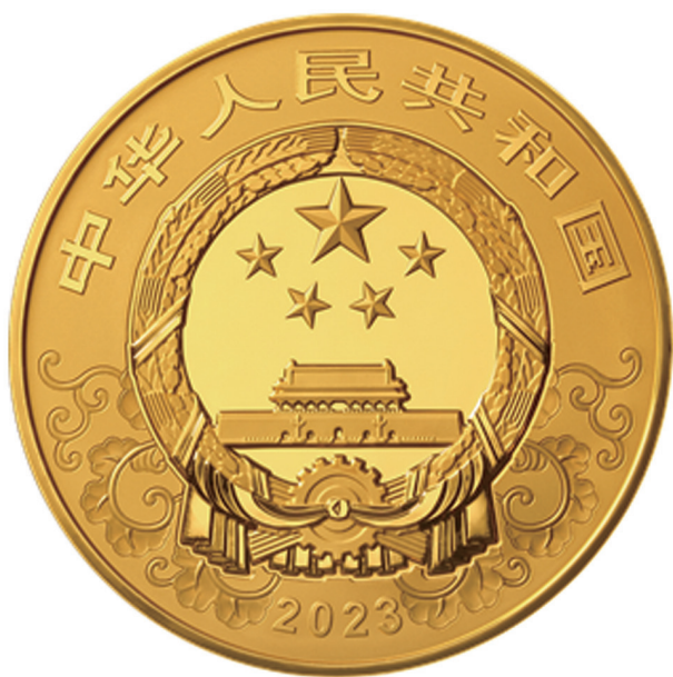
500克圆形精制金质纪念币正面图案