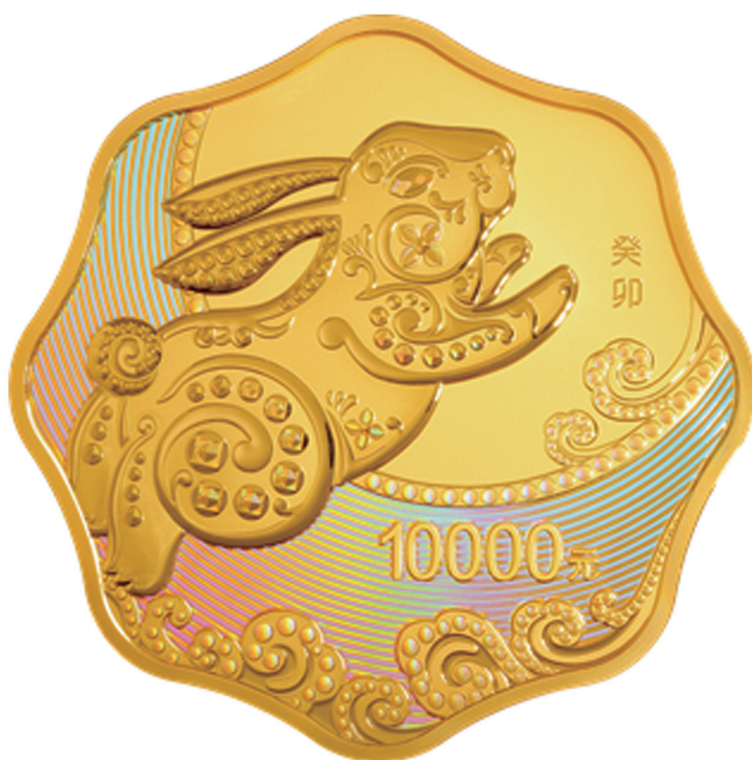
1公斤梅花形精制金质纪念币背面图案