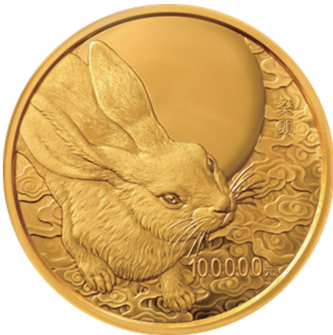
10公斤圆形精制金质纪念币背面图案