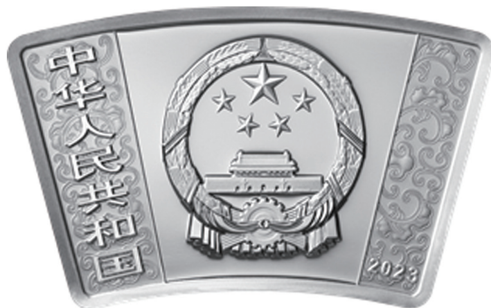
30克扇形精制银质纪念币正面图案