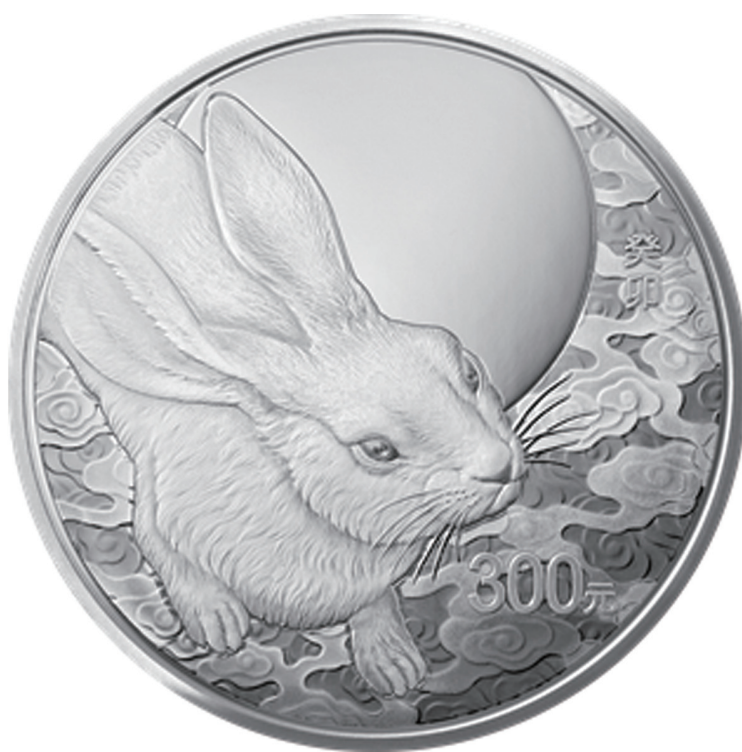
1公斤圆形精制银质纪念币背面图案