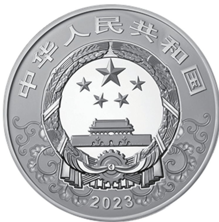
1公斤圆形精制银质纪念币正面图案