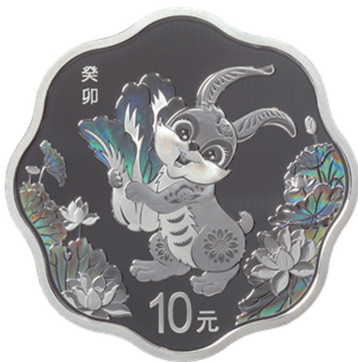
30克梅花形精制银质纪念币背面图案