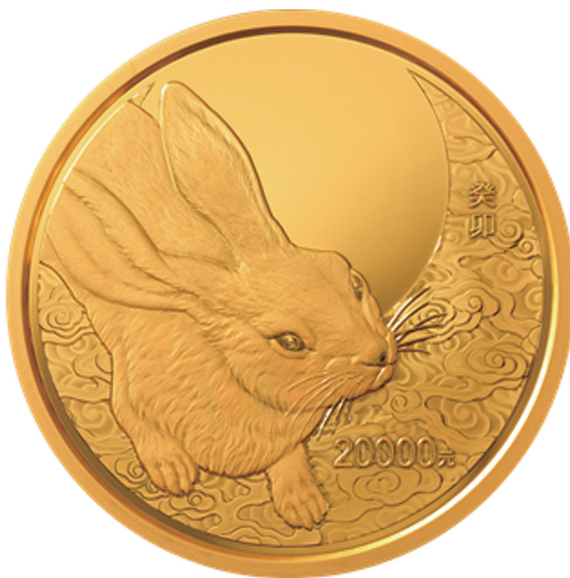
2公斤圆形精制金质纪念币背面图案