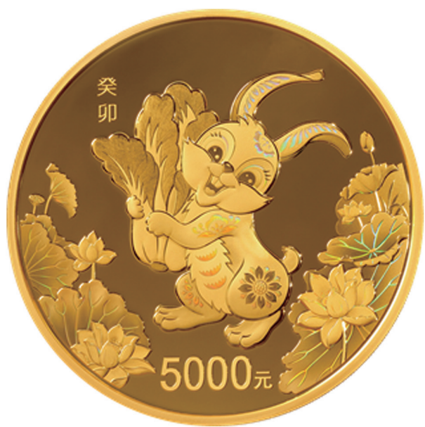
500克圆形精制金质纪念币背面图案