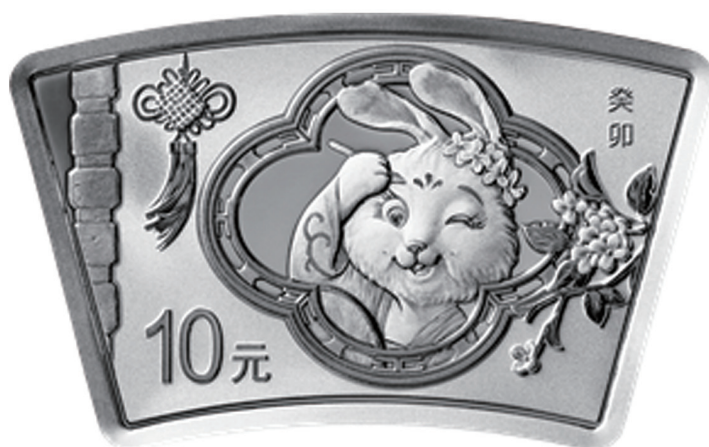
30克扇形精制银质纪念币背面图案