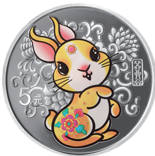
15克圆形精制银质纪念币背面图案