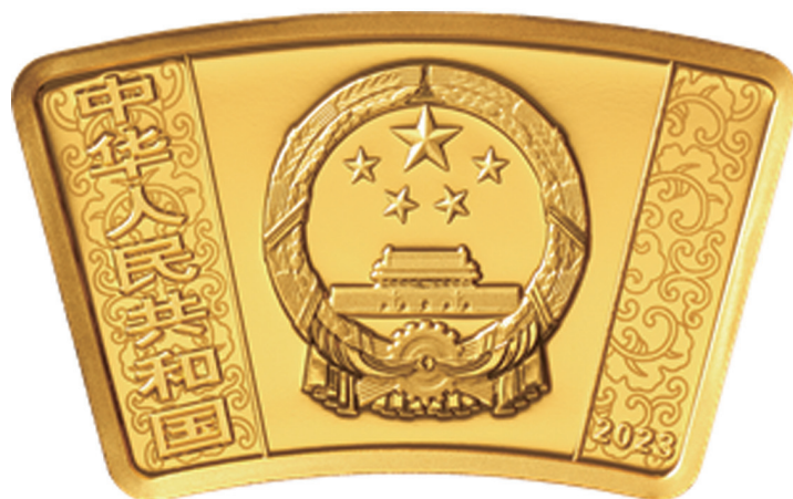
10克扇形精制金质纪念币正面图案