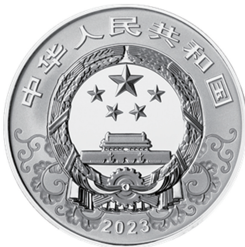
15克圆形精制银质纪念币正面图案