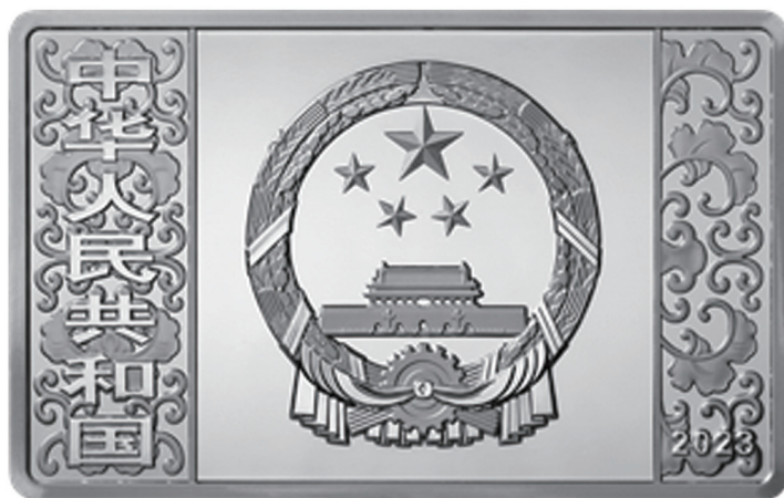
150克长方形精制银质纪念币正面图案