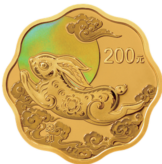
15克梅花形精制金质纪念币背面图案