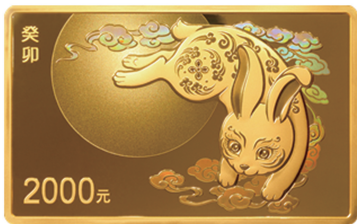
150克长方形精制金质纪念币背面图案