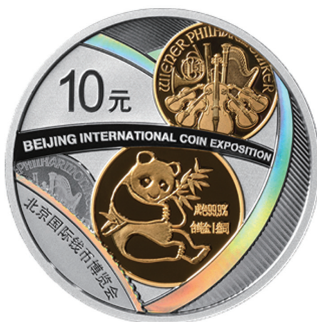
30克圆形精制银质纪念币背面图案