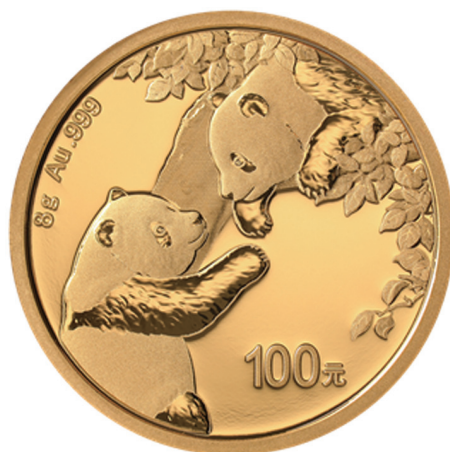
8克圆形普制金质纪念币背面图案