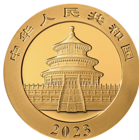
30克圆形普制金质纪念币正面图案