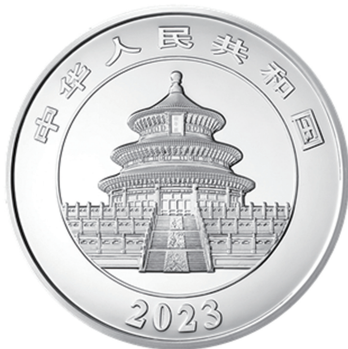
1公斤圆形精制银质纪念币正面图案