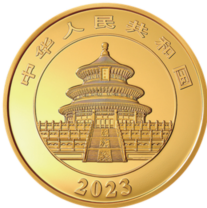
1公斤圆形精制金质纪念币正面图案