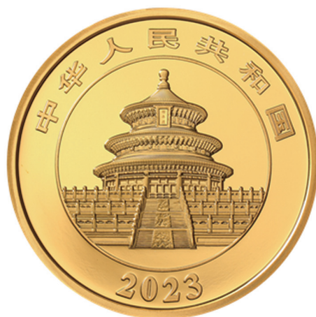
100克圆形精制金质纪念币正面图案