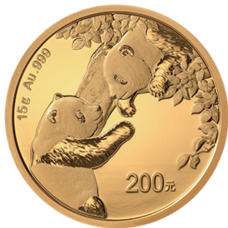
15克圆形普制金质纪念币背面图案