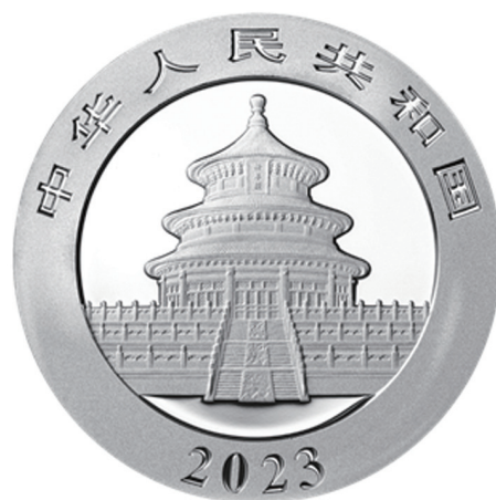
30克圆形普制银质纪念币正面图案