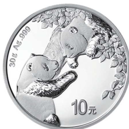
30克圆形普制银质纪念币背面图案