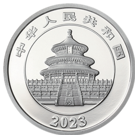
30克圆形精制铂质纪念币正面图案