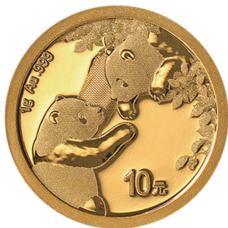
1克圆形普制金质纪念币背面图案