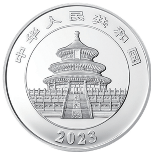
150克圆形精制银质纪念币正面图案