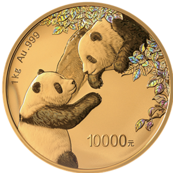
1公斤圆形精制金质纪念币背面图案