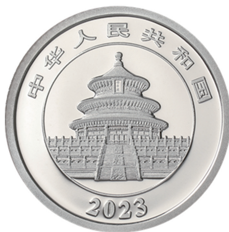
3克圆形精制铂质纪念币正面图案