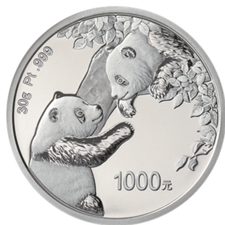
30克圆形精制铂质纪念币背面图案