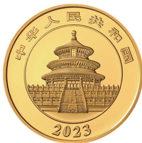
50克圆形精制金质纪念币正面图案