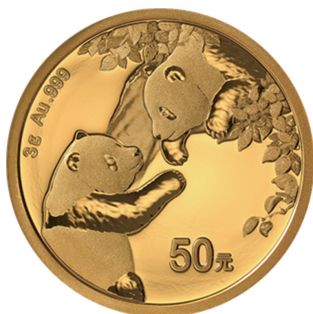
3克圆形普制金质纪念币背面图案