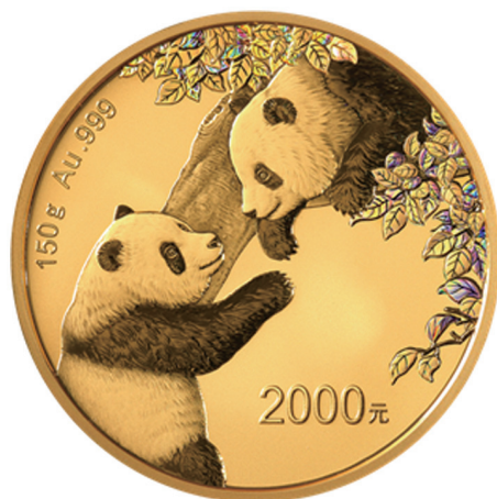
150克圆形精制金质纪念币背面图案