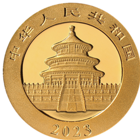
1克圆形普制金质纪念币正面图案