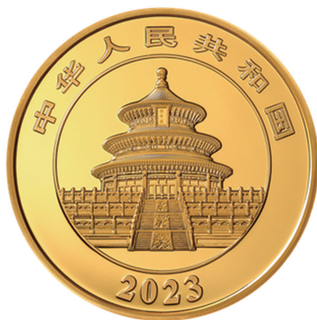
150克圆形精制金质纪念币正面图案