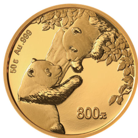
50克圆形精制金质纪念币背面图案