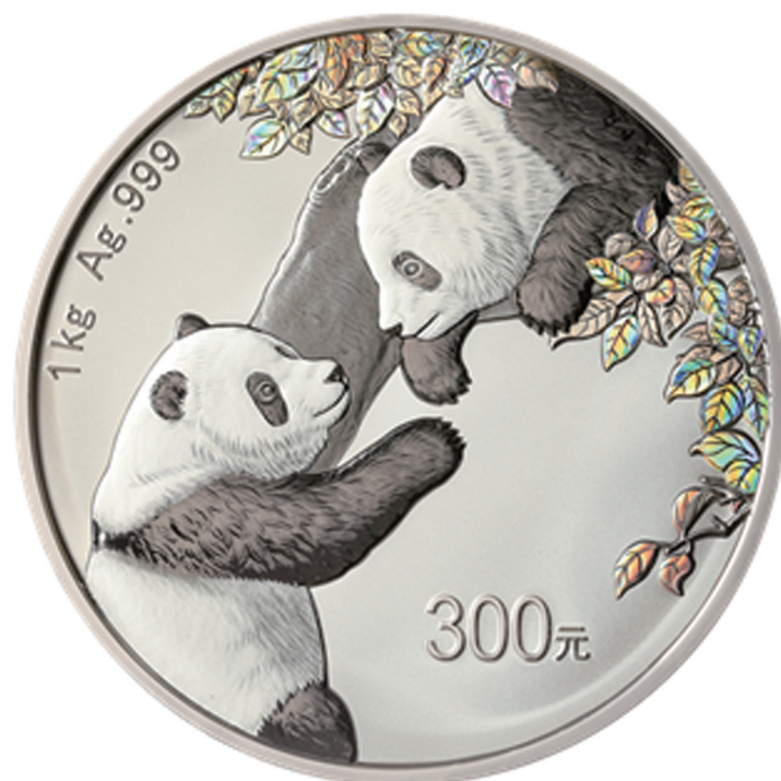
1公斤圆形精制银质纪念币背面图案