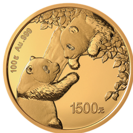
100克圆形精制金质纪念币背面图案