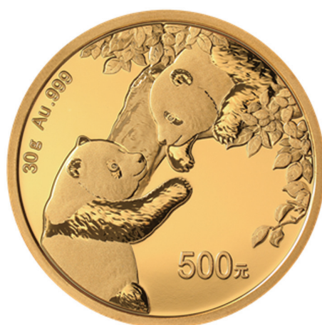
30克圆形普制金质纪念币背面图案