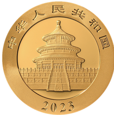
15克圆形普制金质纪念币正面图案