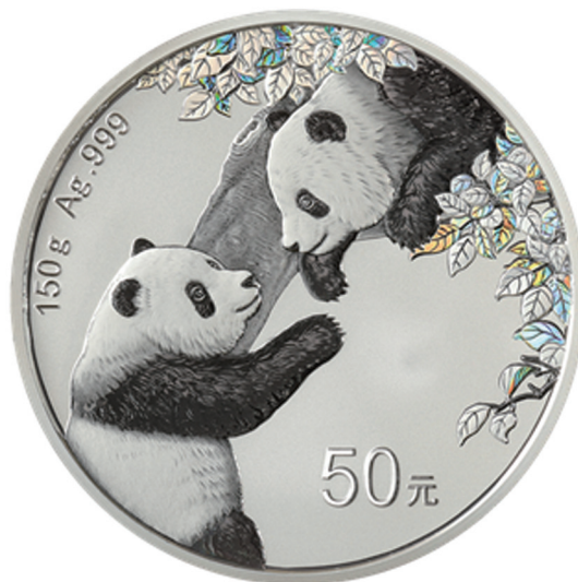
150克圆形精制银质纪念币背面图案