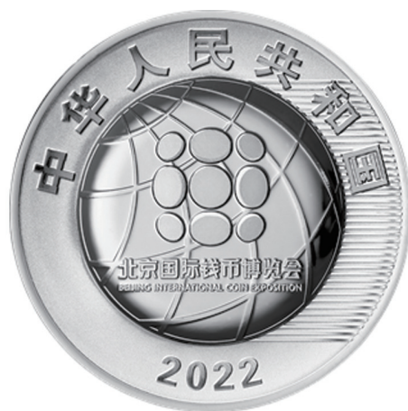
30克圆形精制银质纪念币正面图案