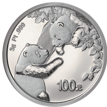
3克圆形精制铂质纪念币背面图案