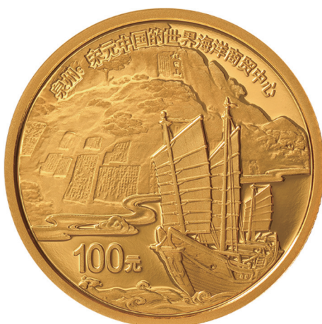
8克圆形精制金质纪念币正面图案