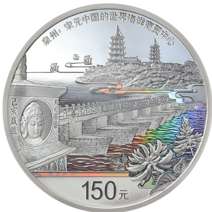
500克圆形精制银质纪念币正面图案