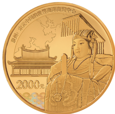
150克圆形精制金质纪念币正面图案