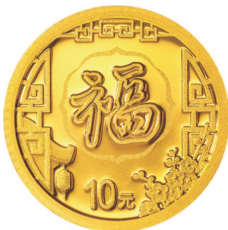
1克圆形普制金质纪念币正面图案