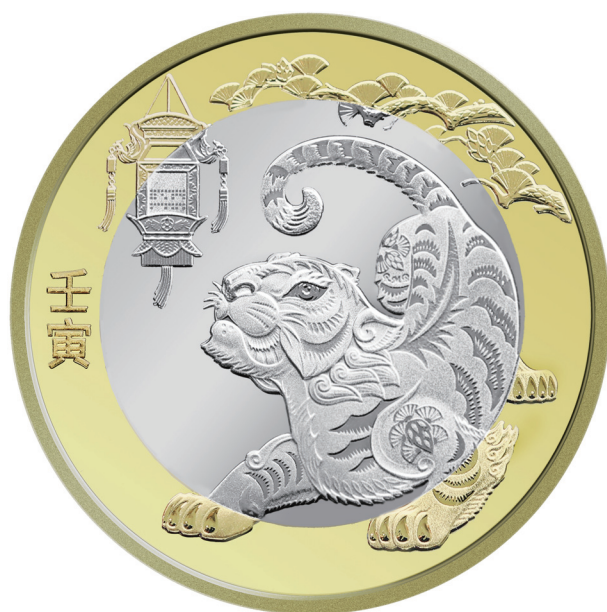
2022 年贺岁双色铜合金纪念币背面图案