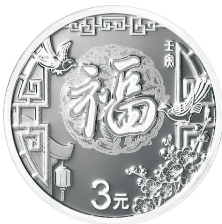
8克圆形普制银质纪念币正面图案