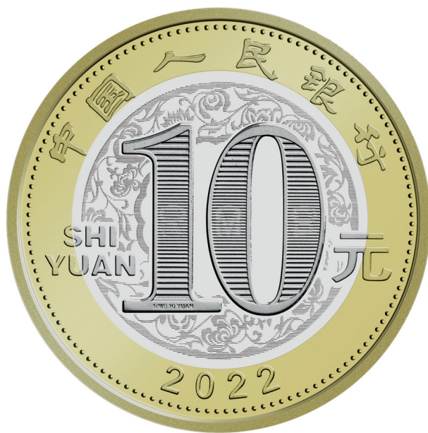
2022 年贺岁双色铜合金纪念币正面图案