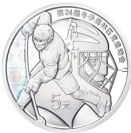
15 克圆形精制银质纪念币正面图案