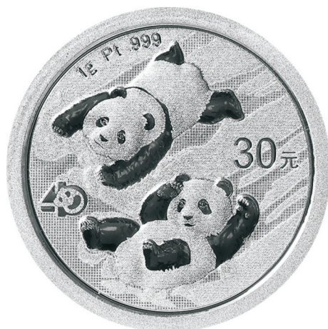
1克圆形普制铂质纪念币正面图案