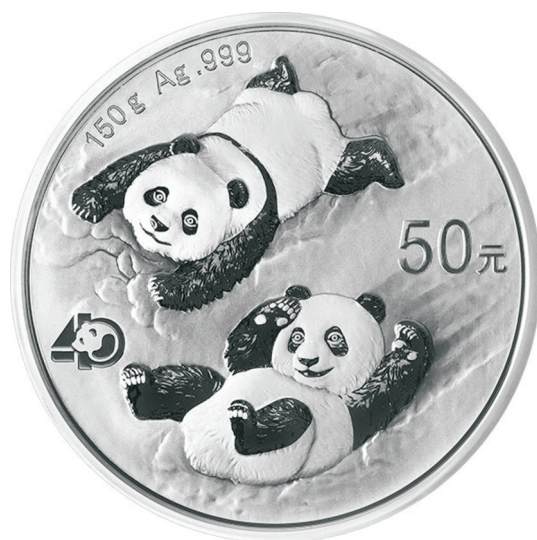
150克圆形精制银质纪念币正面图案