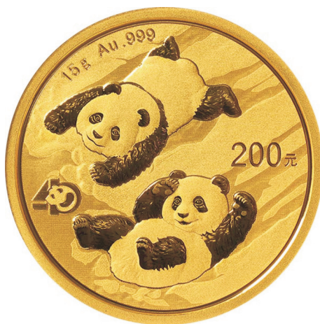
15克圆形普制金质纪念币背面图案