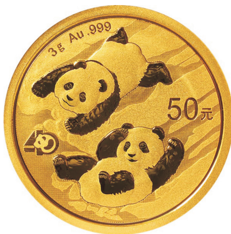
3克圆形普制金质纪念币正面图案