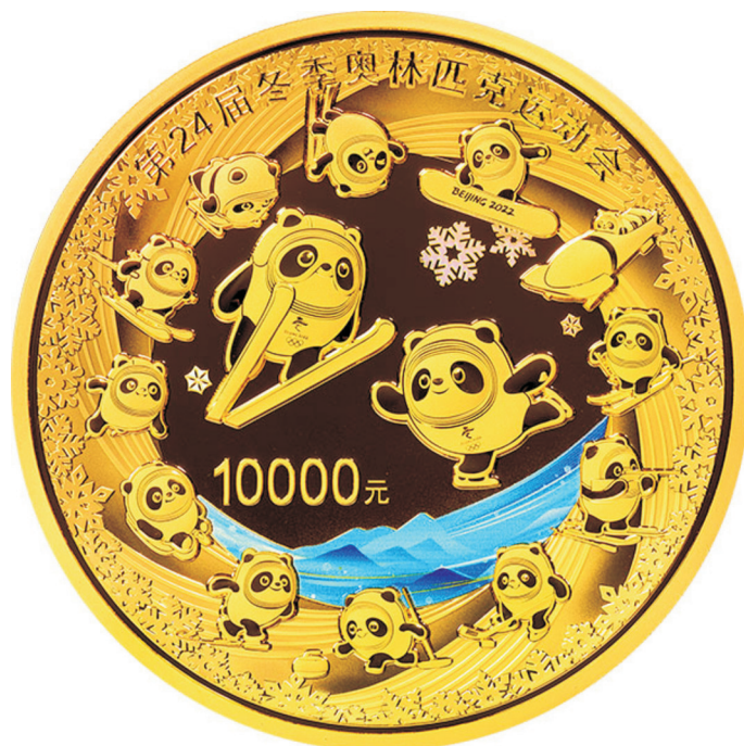
1 公斤圆形精制金质纪念币正面图案