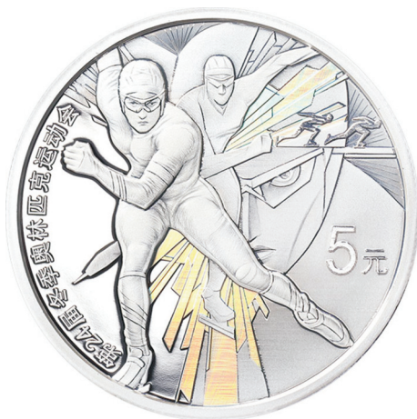
15 克圆形精制银质纪念币正面图案