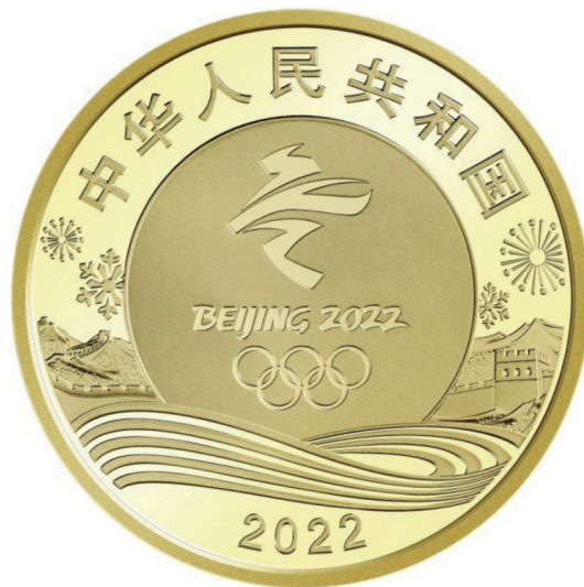
铜合金纪念币——冰上运动项目正面图案