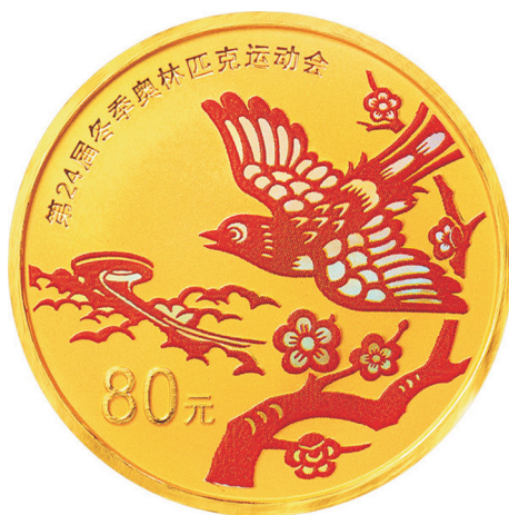
5克圆形精制金质纪念币正面图案