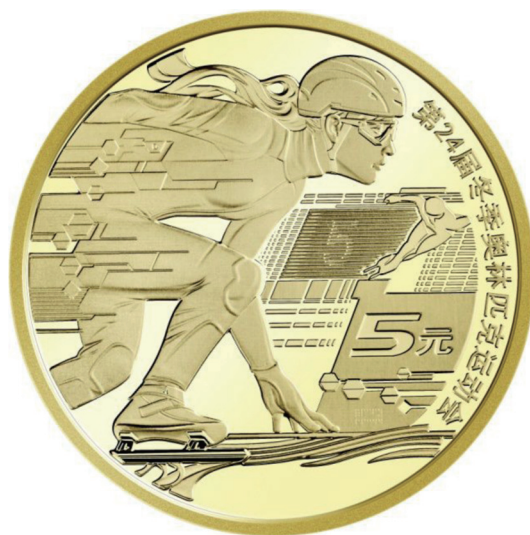
铜合金纪念币——冰上运动项目背面图案