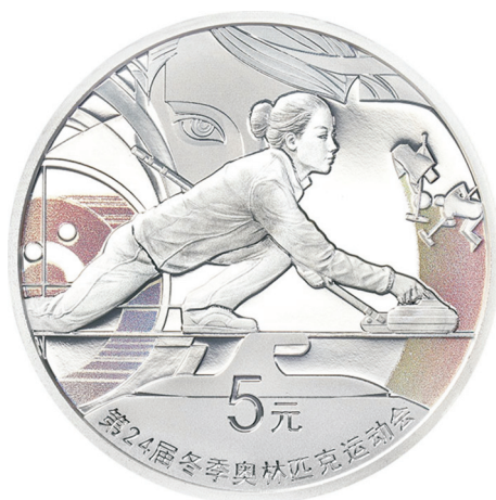
15 克圆形精制银质纪念币正面图案