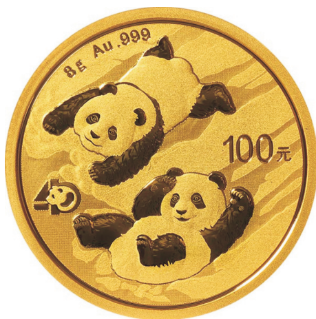
8克圆形普制金质纪念币正面图案