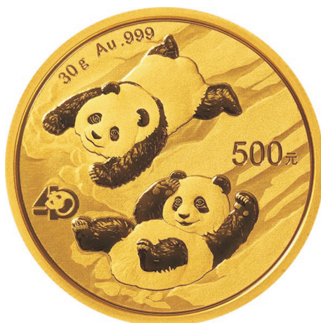
30克圆形普制金质纪念币正面图案