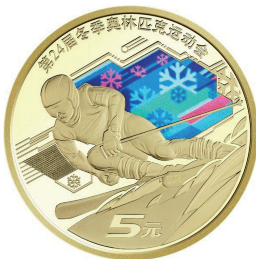
铜合金纪念币——雪上运动项目背面图案