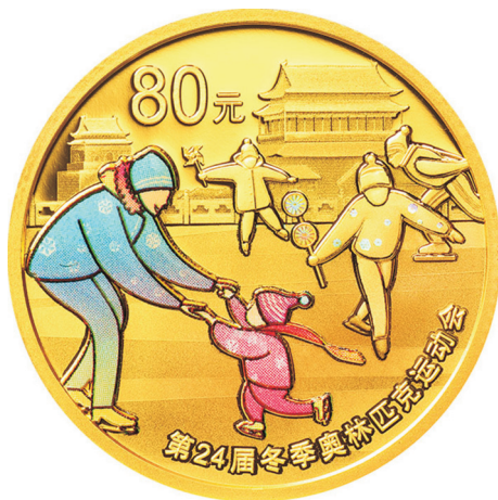
5克圆形精制金质纪念币正面图案