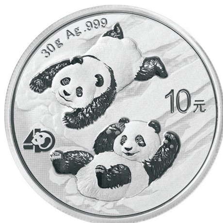
30克圆形普制银质纪念币正面图案