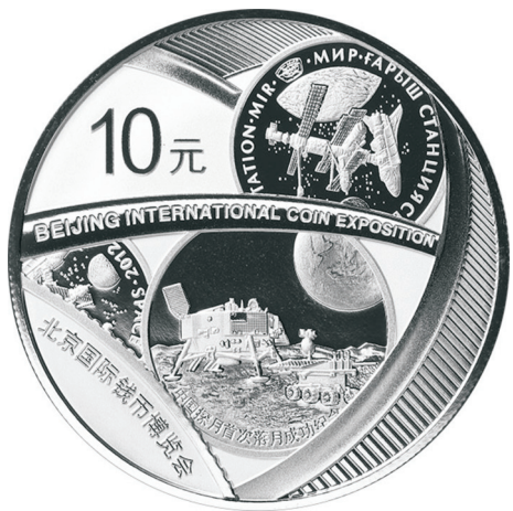
30克圆形精制银质纪念币正面图案