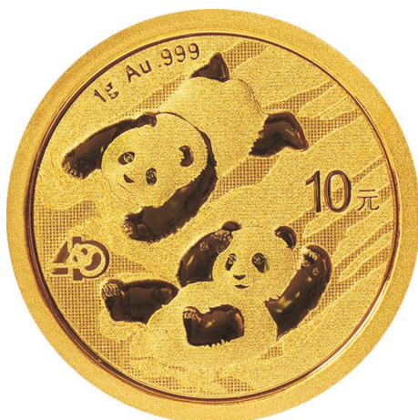
1克圆形普制金质纪念币正面图案