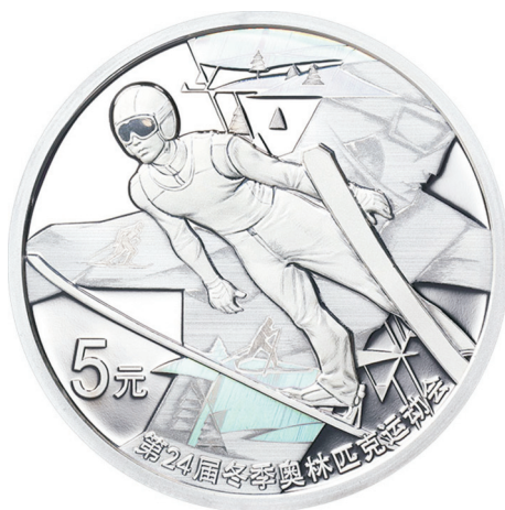
15 克圆形精制银质纪念币正面图案