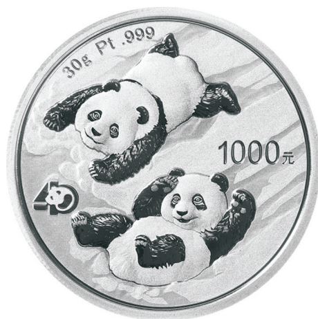
30克圆形普制铂质纪念币正面图案