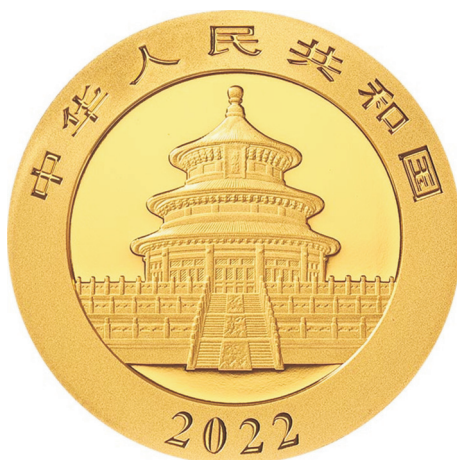
15克圆形普制金质纪念币正面图案