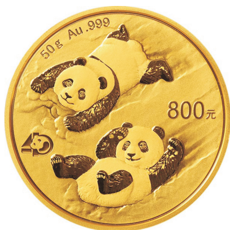
50克圆形精制金质纪念币正面图案