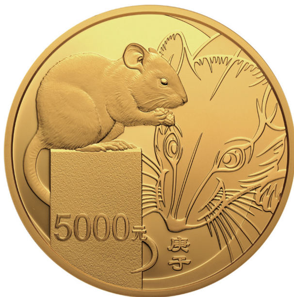
500克圆形精制金质纪念币正面图案