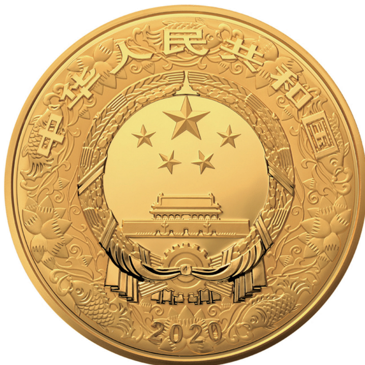
原大 2公斤圆形精制金质纪念币正面图案