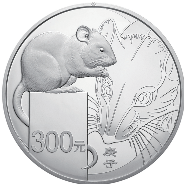
1公斤圆形精制银质纪念币正面图案