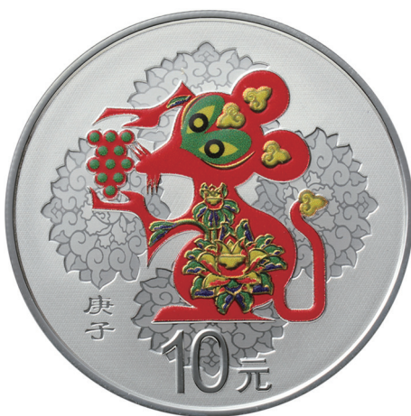
30克圆形精制银质彩色纪念币正面图案