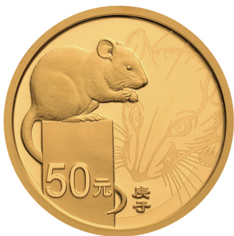
3克圆形精制金质纪念币正面图案