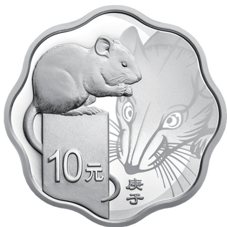
30克梅花形精制银质纪念币正面图案