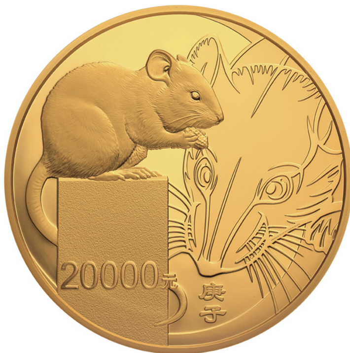
原大 2公斤圆形精制金质纪念币背面图案