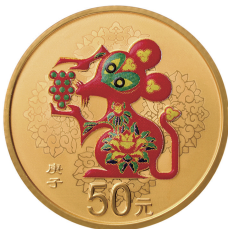
3克圆形精制金质彩色纪念币正面图案