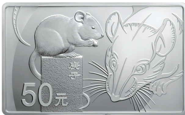
150克长方形精制银质纪念币正面图案