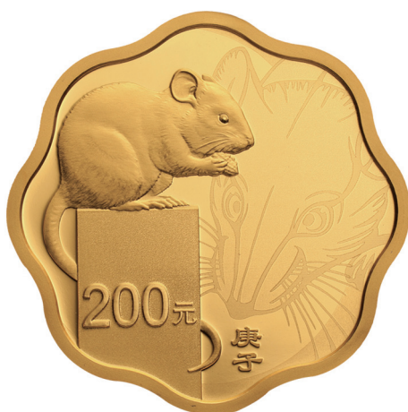
15克梅花形精制金质纪念币正面图案