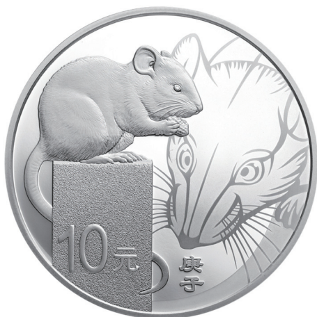
30克圆形精制银质纪念币正面图案