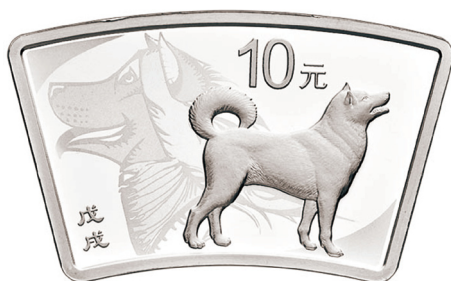
30克扇形精制银质纪念币正面图案