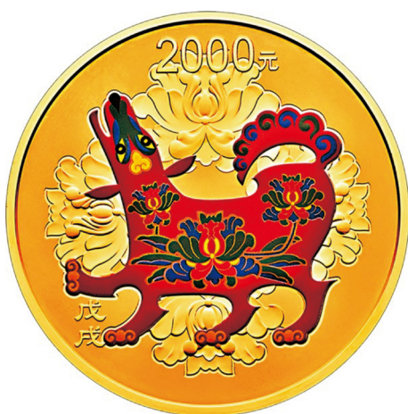
150克圆形精制金质彩色纪念币正面图案