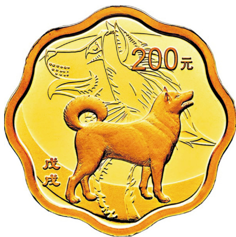
15克梅花形精制金质纪念币正面图案