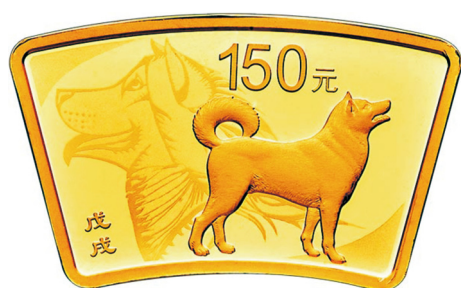
10克扇形精制金质纪念币正面图案