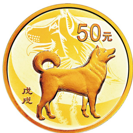
3克圆形精制金质纪念币正面图案