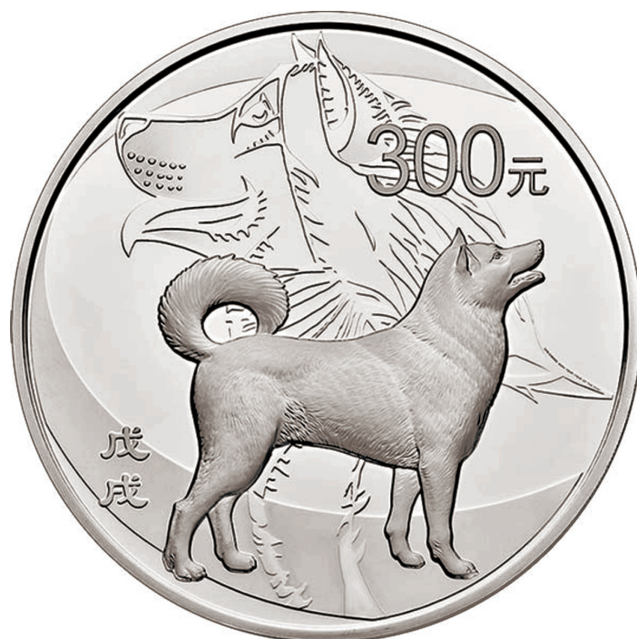
1公斤圆形精制银质纪念币正面图案