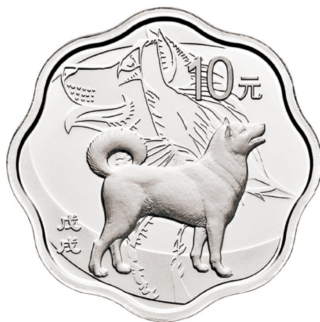
30克梅花形精制银质纪念币正面图案