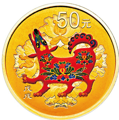
3克圆形精制金质彩色纪念币正面图案