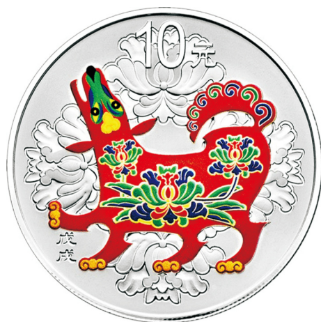
30克圆形精制银质彩色纪念币正面图案