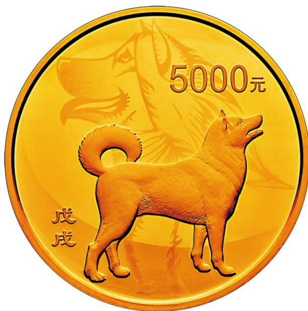
500克圆形精制金质纪念币正面图案