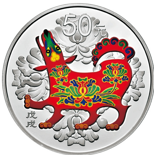
150克圆形精制银质彩色纪念币正面图案